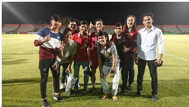
孤児院の卒園生と観戦