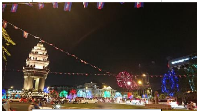
独立記念日の花火