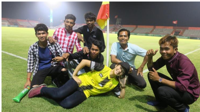
SAJ Farm 職員と観戦

リーグ戦は一般スタンド席で現地通貨の5000リエル（US$1=4000リエル）で観戦することができます。熱狂的なサポーターの数はまだまだ少ないですが数年で変化があるかもしれません。これからのカンボジアの発展が楽しみです。