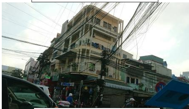
プノンペン市内の電線