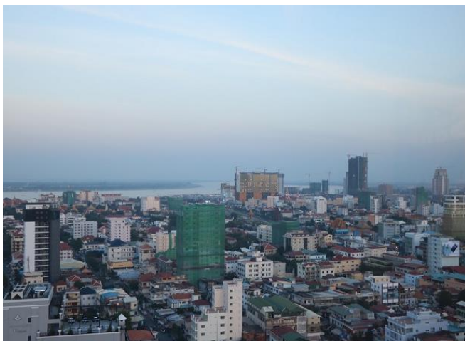
プノンペンタワー22階からの景色

現在カンボジアに在留する邦人の数も増え、プノンペン市内では日本人を見掛けることも多くなりました。日本食が食べられるレストランを併設し、日本語が話せるスタッフがいることを売りにしているホテルもあります。英語だけでなく日本語のできるカンボジア人も多く、今はカンボジアの母国語だけしか話せない人は都市部での就職は困難になってきているようです。