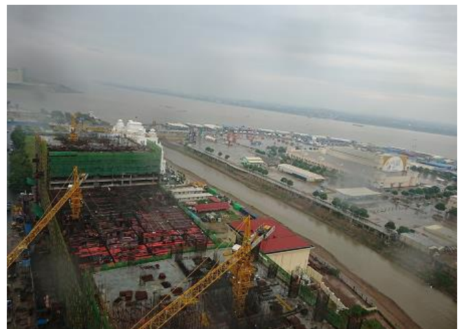
東横インプノンペン23階からの景色