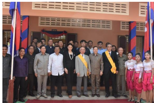
スワイローミット幼稚園・小学校 支援者様 横浜 大江電機(株)社員一同 様