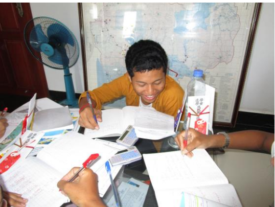
プノンペン事務所での自主学习