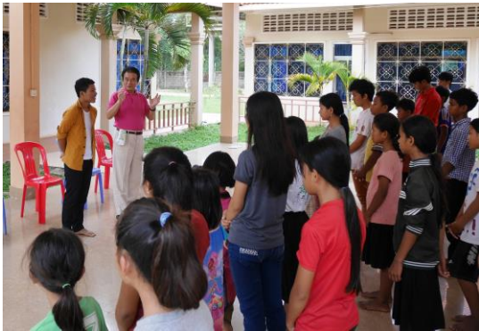
在園生に合格の報告をするニセツト君

今は国の医師免許を持たない人は、病院や医院を開業できません。それと同じことが薬局（薬屋）にも言えて、2016年からは大学の薬学部を卒業し薬剤師の資格を持った人しか薬局（薬屋）を開業できなくなりました。いずれは現在開業している薬局も資格が必要とされています。