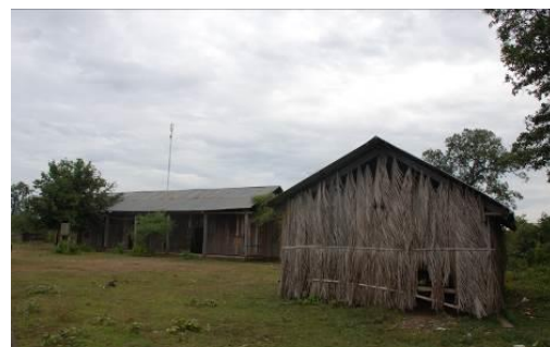
タボンクラ小学校 手前の校舎の壁はヤシの葉でできています。