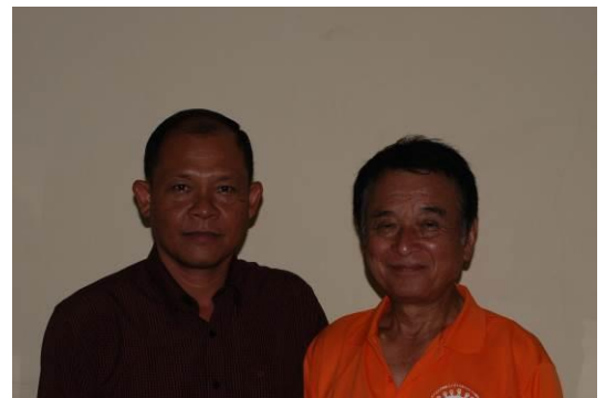
ヒエンポーリ教育長(左)と住田事務局長(右)