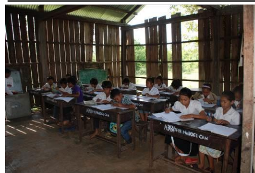
タボンクラ小学校教室内 (上写真奥側校舎)