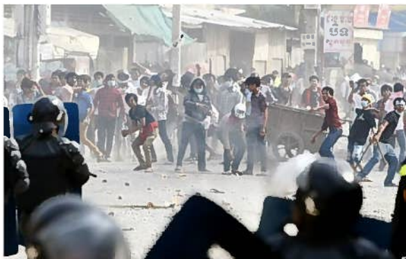
最低賃金値上げを訴えるデモ 警官隊に石を投げています

また、物価の上昇も著しく、校舎建設費も上がりました。SAJ では入札により建設価格を決めています。どこの建設会社も値上がりしています。今では 5 教室建設で輸送費も合わせて 6 万 5 千ドルになります。現在は学校建設の数を減らす方法で検討しています。