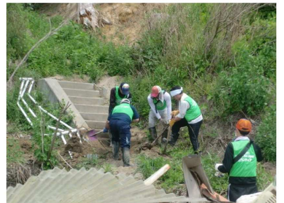
復興支援ボランティアの隊