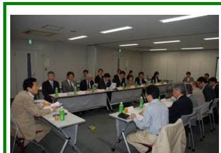
定時評議員会に出席の方々