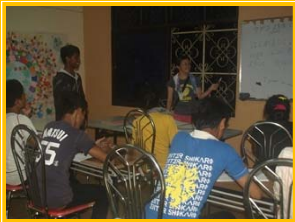
一人ひとり発音の練習

皆さん、こんにちは。日本では猛暑が続いている季節かと思えます。カンボジアでは夕方にスコールがありますが、昼間は毎日35度を超えています。スコールの後には暑さも和らぎますが、子どもたちの中には急な温度変化についていけず、風邪を引いてしまう子もいます。