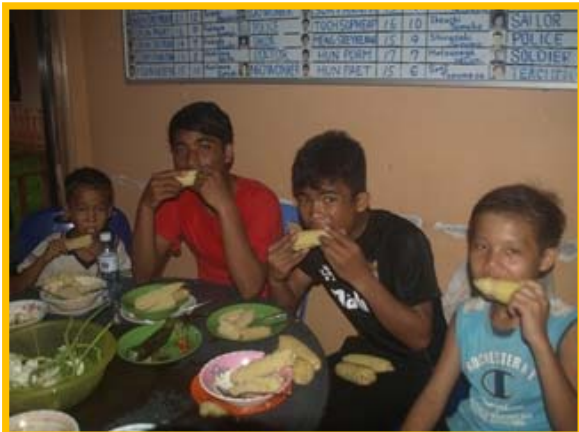
1人で5本以上も食べる男の子の姿も・・・