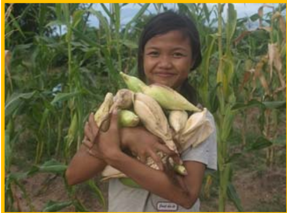
収穫の喜びをかみしめながらニンマリ