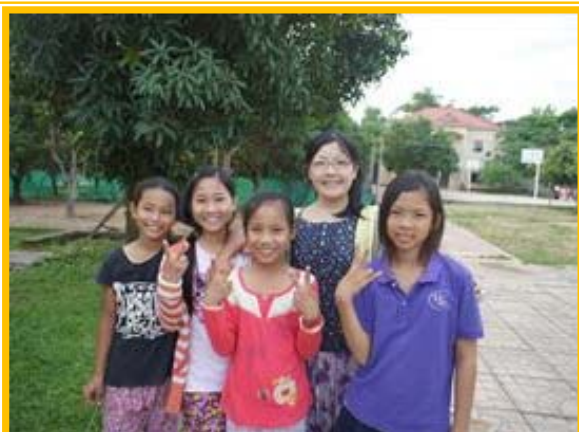
どうぞよろしくお願いいたします。