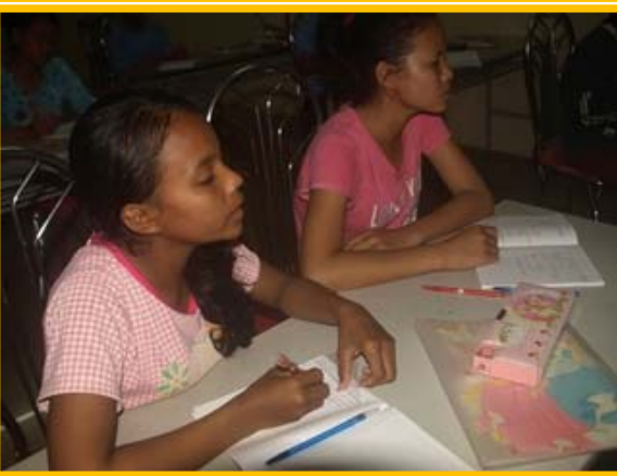
ノートを取りながら先生の説明を真剣に聞く

カンボジアで働くには、第2、第3の言語が必要不可欠です。英語、仏語など様々な選択肢のある中で、日本人のいる孤児院で暮らす機会を十分に活かし、是非日本語を習得し、将来、安定した収入のある暮らしを送れるようになって欲しい、と心から思います。