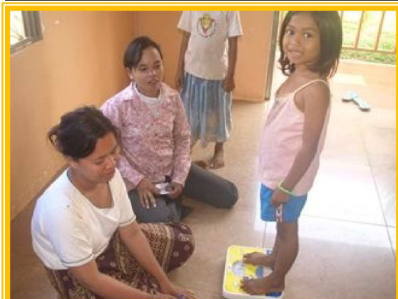
体重も増えて、どんどん成長します