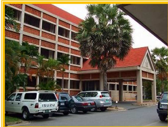
プノンペンの日本の援助でできた結核病院