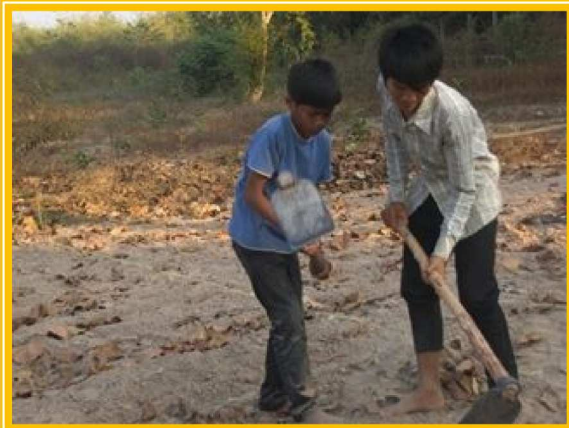
自分の畑をもらって耕していく