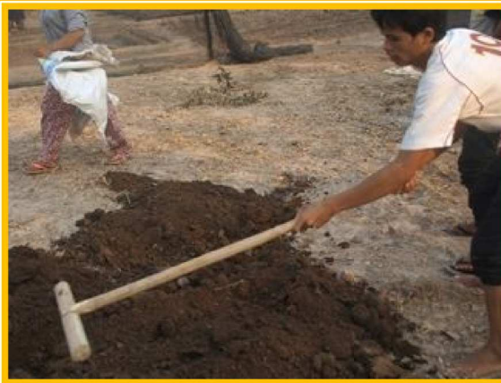
堆肥も自分たちで準備(子ども手作りの鋤)

皆さんこんにちは。カンボジアでは雨季から乾季に変わり、その乾季の中でも最も暑い4月に近づいています。日差しは日毎に肌を差すように暑くなります。昼食の時間も補習授業の時間も部屋の中は暑く、汗を流しながら、手で顔を仰ぎながらの毎日です。